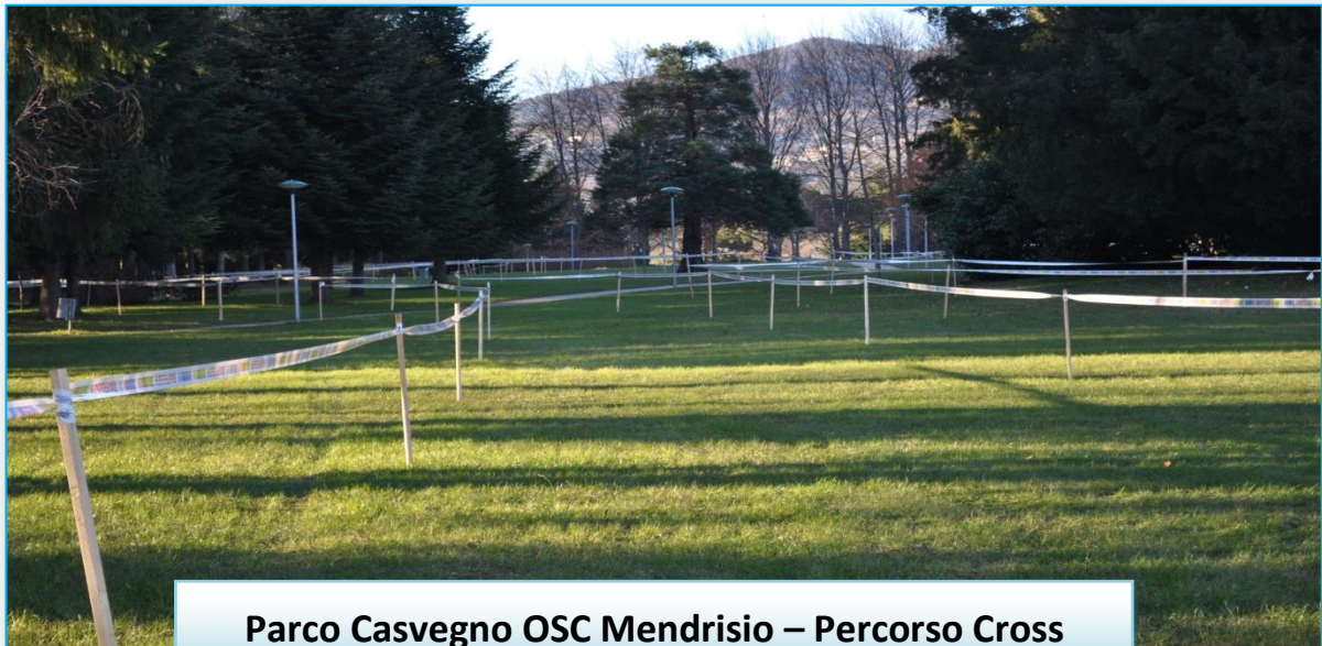
Parco Casvegno OSC Mendrisio – Percorso Cross